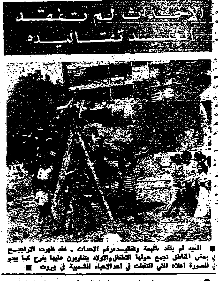
العديد لم يقدر طليعة ويقاد منم الأحداث . فقد ظهرت التراجيح في بعض المناطق تجمع حولها الافعال والاولاد يتفكرون عليها يفرح كما يبدو في الصورة اعلاه التي التقطت في احد الاحياء الشعبية في بيروت